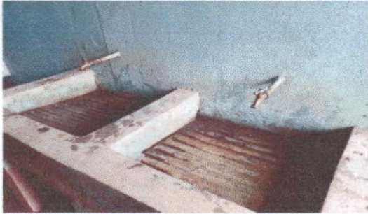
Foto7: Colocacion de mozaico en lavamanos y baños